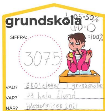
Figur 4. Ett exempel på svar i ÅSUBs statistikbingo

En betydande del av ÅSUBs förmedling och kommunikation innebär att personalen tar fram uppgifter efter beställning och deltar i sakkunnigorgan för att sprida och tillgängliggöra statistiken och resultaten. ÅSUB får dagligen frågor av varierande karaktär. Personal har under berättelseåret tagit fram faktaunderlag för lagframställningar och för behandlingen av olika ärenden i lagtinget samt även i övrigt bistått självstyrelseförvaltningen och övriga intresserade med statistik- och utredningsunderlag. Sammanställningar, analyser och metodhandledning på basen av förfrågningar har blivit en allt viktigare del av ÅSUBs utåtriktade service.