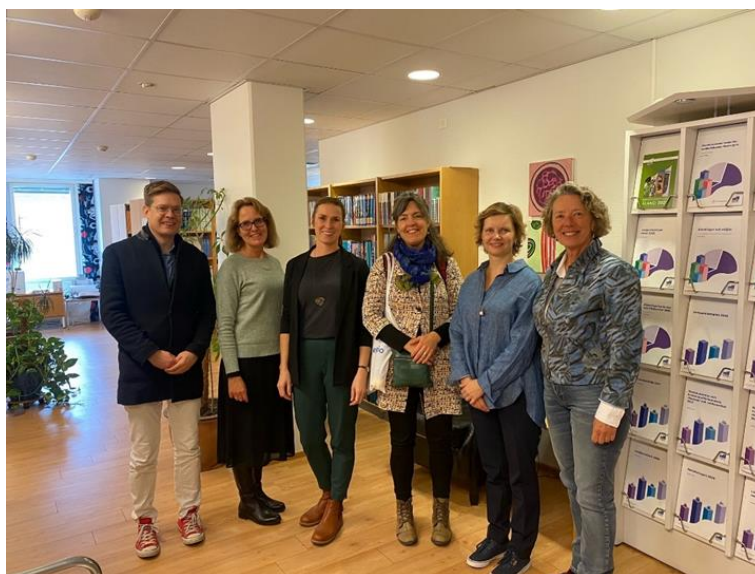
Medverkande från Nordregio och ÅSUB i seminariet framtidens arbetsmarknad och grön omställning oktober 2022.

En målsättning för ÅSUB har varit att öka långsiktigheten i produktionen genom att prioritera återkommande projekt samt projekt som faller inom ÅSUBs prioriterade områden. För att säkerställa beslutsfattarnas mera omedelbara behov av kunskapsunderlag tillämpas ramavtal samtidigt som ÅSUB ökat användningen av analysverktyg som kan möta mera kortsiktiga analysbehov inom till exempel lagberedningen och landskapsförvaltningens utvecklingsarbete. ÅSUB har ingått ramavtal och långsiktiga avtal med landskapsregeringen och med externa forskningsinstitut.