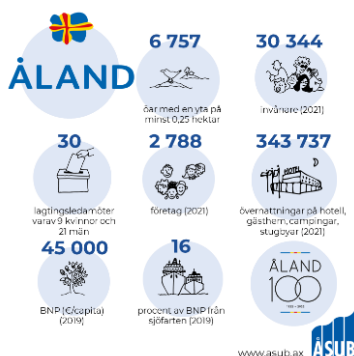
Figur 3. Presentation av det 100-åriga självstyrda Åland

Drygt en tredjedel av de åländska skolorna deltog i ÅSUBs statistikbingo. De tre klasser som vann ett bidrag till klasskassan var Sunds skolas åk 6, Ödkarby 5–6 och Ytternäs klass 6B. Många fina bidrag lämnades in. Bingot fick positiv feedback från elever och lärare och gjordes om till ett skolmaterial som kan användas även utanför tävlingen.