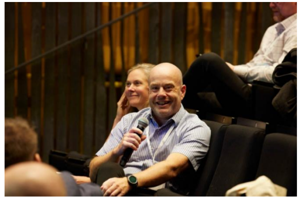
De ÅSUBs medarbetare som deltog i Statistikermötet i Reykjavik var aktiva medverkande både som presentatörer och som engagerade åhörare.