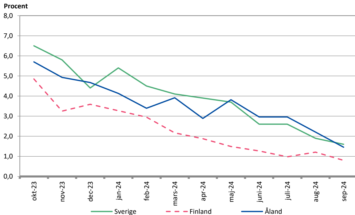
Figur 1. Förändringar i konsumentprisindex under tolv månadersperioder

De åländska konsumentpriserna steg med 1,5 procent i september 2024 jämfört med september 2023, i augusti var ökningstakten 2,2 procent. I september inverkade högre priser inom huvudgruppen bostäder, vatten, elektricitet, gas och övriga bränslen mest på den totala uppgången (med 0,6 procentenheter uppåt). Det har även varit betydande prisökningar i huvudgruppen diverse varor och tjänster (med 0,4 procentenheter uppåt). Lägre priser inom huvudgrupperna inventarier, hushållsutrustning och rutinunderhåll av bostaden, hälsovård, transport samt utbildning motverkade uppgången marginellt. Från augusti till september sjönk konsumentpriserna med i genomsnitt 0,1 procent.